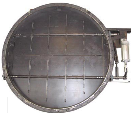
Serranda bipala a movimento contrapposto con comando pneumatico DIMENSIONI a richiesta