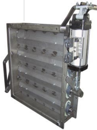
Serranda ad alette contrapposte con movimentazione pneumatica DIMENSIONI a richiesta