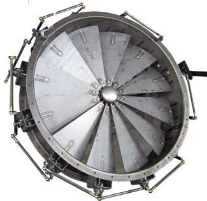
Regolatore di portata con comando manuale DIMENSIONI a richiesta