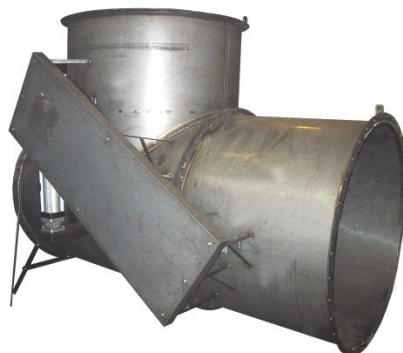
Diverter di grande diametro con azionamento pneumatico DIMENSIONI a richiesta